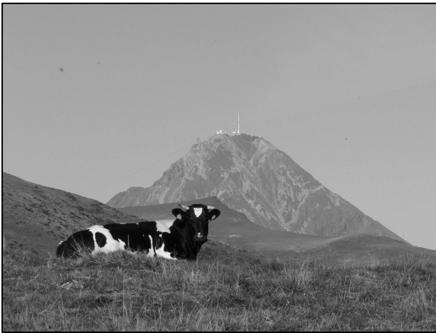
Une race de vache peu commune dans nos estives